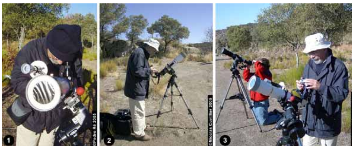
Fig. 3. O autor enquanto obtinha algumas das imagens: 1- com gorro para o frio, ainda cedo, a preparar o telescópio e alinhar o buscador (veja-se o filtro AstroSolar Baader na frente do telescópio e do buscador); 2 e 3- a fazer fotografias de diferentes momentos do eclipse.

As várias fotografias apresentadas neste artigo documentam as diversas fases do eclipse e o equipamento utilizado pelo autor. A hora de ocorrência de cada uma das imagens foi obtida através do ficheiro exif que está associado a cada imagem digital (para o efeito, o relógio interno da câmara digital foi antecipadamente acertado pela hora legal, obtida no website do Observatório Astronómico de Lisboa ( www.oal.ul.pt )).