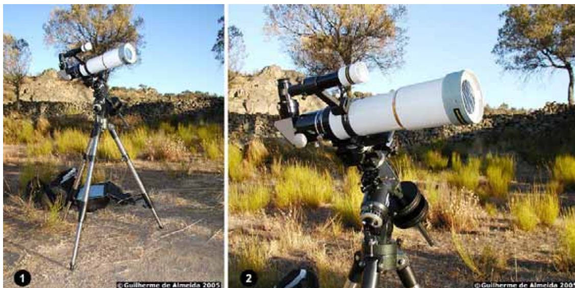
Fig. 2. Equipamento utilizado pelo autor para obter as imagens do eclipse anular documentadas neste artigo: 1- vista global; 2- tubo e montagem equatorial. (Guilherme de Almeida 2005).

para observação solar, com um factor de transmissão de 1/100 000, confeccionados com a película metalizada AstroSolar , produzida pela empresa alemã Baader Planetarium ( www.baader-planetarium.de ). Fotografei pelo método afocal, utilizando no telescópio uma ocular de Plössl de 32 mm de distância focal acoplada à minha câmara digital Olympus C3020 Zoom .