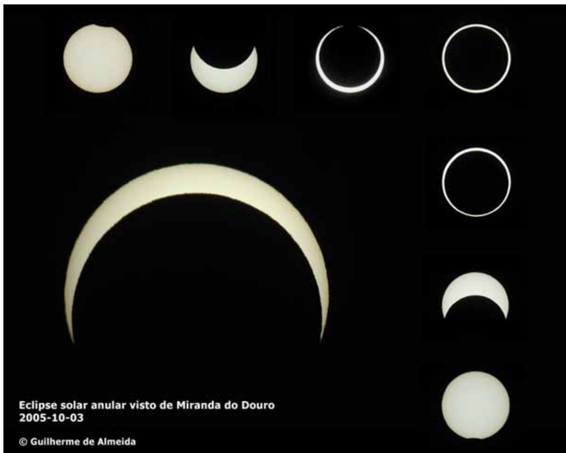
Fig. 4. Composição de algumas das imagens obtidas durante o eclipse anular de 3 de Outubro de 2005. A imagem maior, obtida às 10:03 (8 minutos depois da anularidade centrada) foi feita em maior escala, para dar destaque a essa fase (Guilherme de Almeida 2005).

Independentemente das imagens obtidas, um eclipse do Sol desta magnitude desencadeia sensações emocionantes, nem sempre fáceis de descrever. Pouco depois do "primeiro contacto" (momento em que o disco da Lua começa a intersectar o do Sol), alguém anunciava "já começou!", com a voz emocionada. Quando mais de metade do Sol estava coberta pela Lua, antes do máximo do eclipse, a temperatura começou a baixar sensivelmente e notou-se um vento frio. Voltou a notar-se o mesmo vento na fase correspondente depois do máximo do eclipse. Pensa-se que este vento, conhecido como "vento de eclipse" tenha a sua origem no abaixamento de temperatura local provocado pelo bloqueio da radiação solar, resultando daí diferenças de pressão atmosférica local que impulsionam o vento.