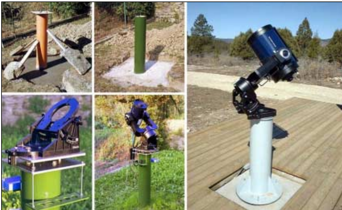
Figura 1- Exemplo de dois pilares idealizados para suportarem telescópios Meade LX200.

A Figura 1 mostra dois pilares (um fixo e outro amovível) idealizados para suportar telescópios catadiópticos Meade LX200.