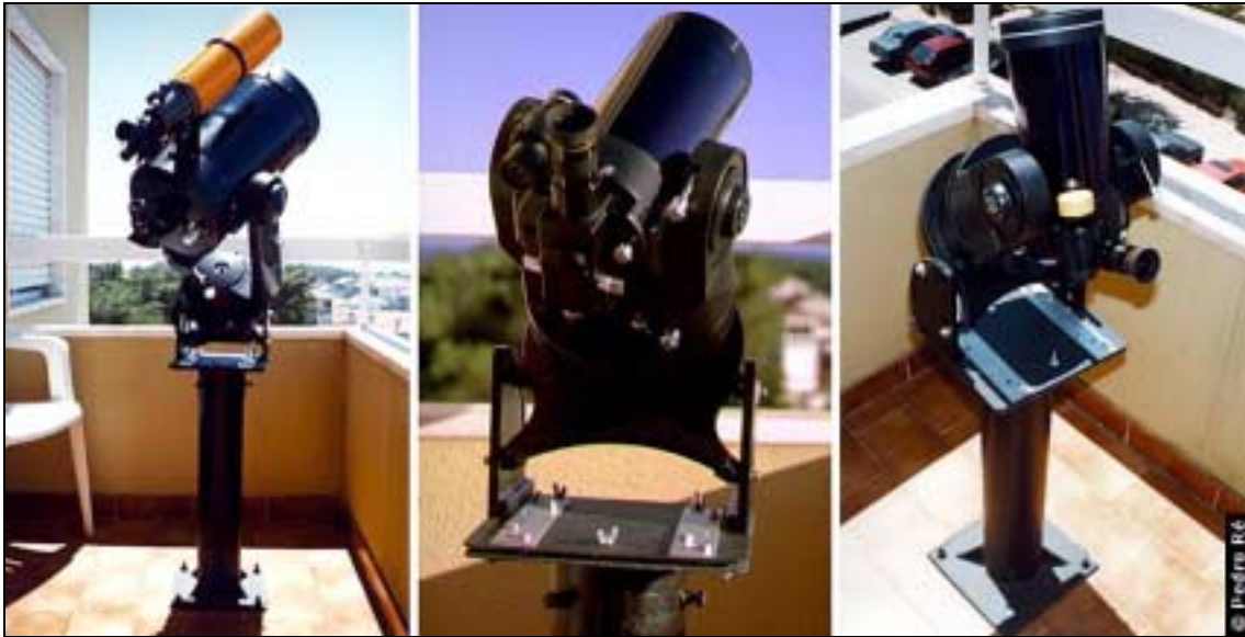
Figura 2- Pilar que permite a montagem de diversos instrumentos.

A Figura 2 exemplifica um pilar amovível de simples construção que permite a instalação de diversos instrumentos de observação (Celestar 8 e Meade ETX entre outros). O referido pilar foi instalado na varanda de um apartamento. Os instrumentos de observação podem ser montados neste sistema fixo em poucos minutos.