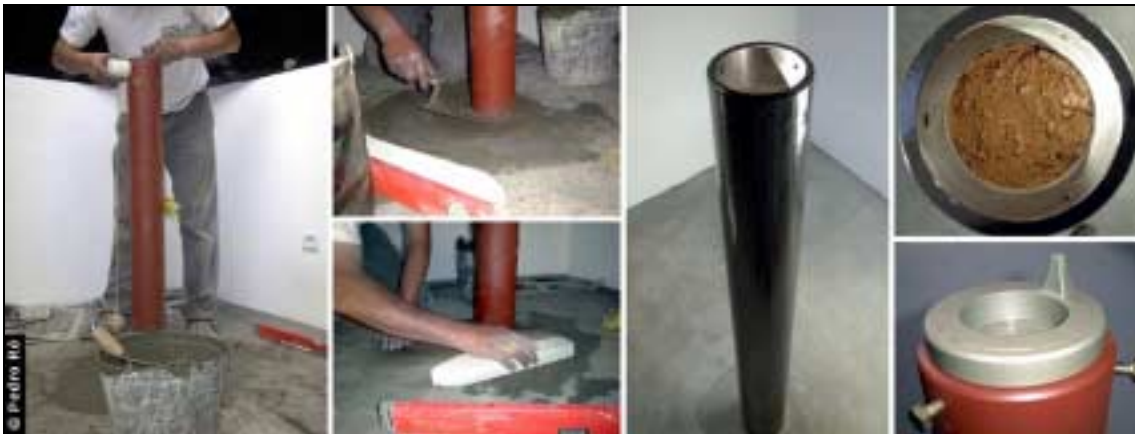
Figura 3- Pilar instalado no interior de um observatório.

Finalmente a Figura 3 ilustra um pilar instalado no interior de um observatório e que suporta uma montagem Vixen GP ou GP-DX.